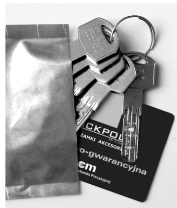
zabezpieczone klucze i karta kodowa

Wkładka dedykowana szczególnie dla producentów stolarki oraz salonów sprzedających drzwi, a także firm deweloperskich. Dzięki specjalnej konstrukcji finalny użytkownik ma gwarancję, że niepowołane osoby nie miały wcześniej dostępu do jego kluczy. Wkładka dostarczana jest z tzw. kluczem serwisowym wykonanym z mosiądzu oraz specjalnie zabezpieczonymi przed osobami niepowołanymi kluczami użytkownika. Montaż drzwi i wkładki odbywa się przy użyciu klucza serwisowego. Po wyjęciu z zaplombowanego opakowania kluczy użytkownika ich pierwsze użycie powoduje, że klucz serwisowy przestaje działać. Osoba która miała dostęp do klucza serwisowego nie ma już możliwości otwarcia drzwi.