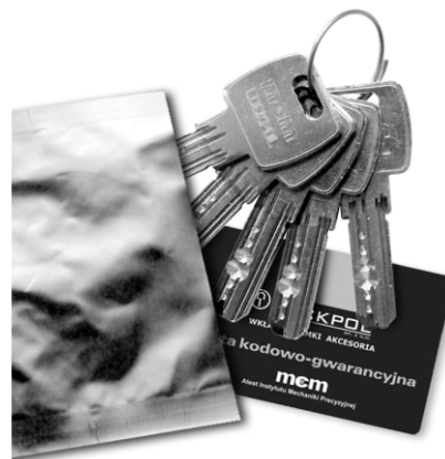
zabezpieczone klucze i karta kodowa

Trwałość: 100 tys. cykli Zabezpieczenie: Klasa 6 najwyższa Odporność na atak: Klasa 2 najwyższa Odporność na włamanie: Klasa B